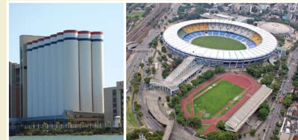
Moinho Dias Branco-BA | Estádio Maracanã-RJ

Ponte Estaiada Octavio Frias de Oliveira (SP), Ponte Estaiada de Teresina (PI), Aeroporto de Congonhas (SP), Aeroporto Zumbi dos Palmares (AL), Aeroporto Internacional de Salvador Deputado Luiz Eduardo Magalhães (BA), Aeroporto de Limeira (SP), Metrô de São Paulo – Linhas 4 e 2 (SP), Metrô de Recife (PE), Reforma do Maracanã e Maracanãzinho (RJ), Estádio João Havelange (RJ), Estádio de Barueri (SP), Barragem Poço Marruá (MA), UHE Estreito, fases 1 e 2 (TO), Complexo do Alemão (RJ), Ponte sobre o Rio São Francisco (BA), Ponte Juazeiro-Petrolina (PE), Barragem Pirapama (PE), Duplicação da BR 232 (PE), Plataforma P-34 (RJ), Gasoduto OSBAT (SP), Gasoduto Uruçu-Coari (AM), Termobahia (BA), Concessão BA 099 (BA), Concessionária LAMSA (RJ), RODOANEL (SP), Obras de Ampliação da Refinaria Landulfo Alves (BA), Porto de SUAPE (PE), Modernização REVAP (RJ), Complexo FORD Camaçari (BA), GASBOL – Gasoduto Bolívia-Brasil, UHE ITÁ (PR), Complexos Imobiliários (BA), ADEMI-BA, SINDUSCON-BA, Estradas e Refinarias na Bolívia, Perimetral Portuária (SP), Tribunal Regional Federal (DF), Tribunal Superior do Trabalho (DF), Tribunal Regional do Trabalho (MT), Tribunal Regional do Trabalho (SP), Centro de Convenções Ulysses Guimarães (DF), Projetos de Esgoto e Saneamento em todo o Território Nacional, dentre outras.