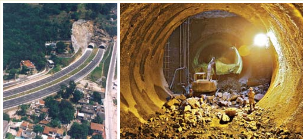
Concessão Rodoviária LAMSA-RJ | Metrô de São Paulo Linha 4-SP