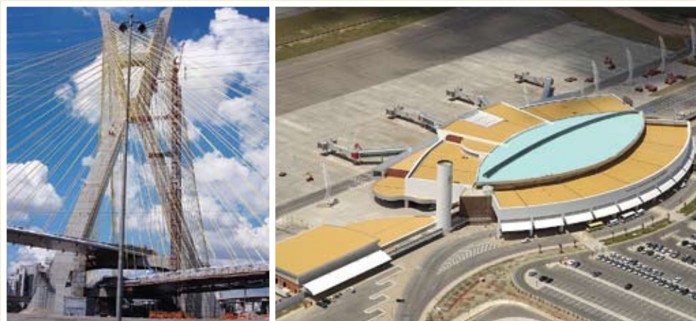
Ponte Estaiada Octavio Frias de Oliveira-SP | Aeroporto Maceió-AL