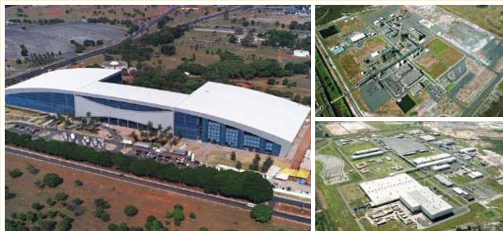
Centro de Convenções Ulysses Guimarães-DF | Monsanto-BA | FORD Planta de Piso-BA