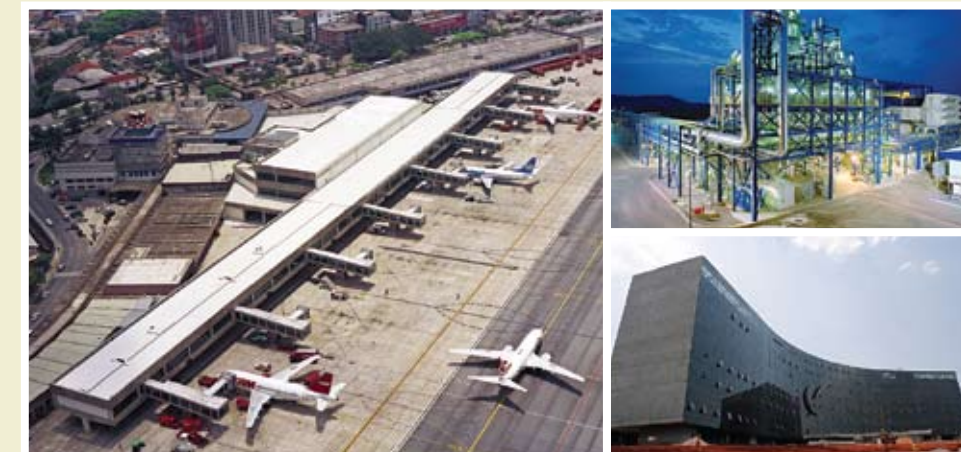
Aeroporto Congonhas-SP | Termobahia-BA | TST Brasília-DF