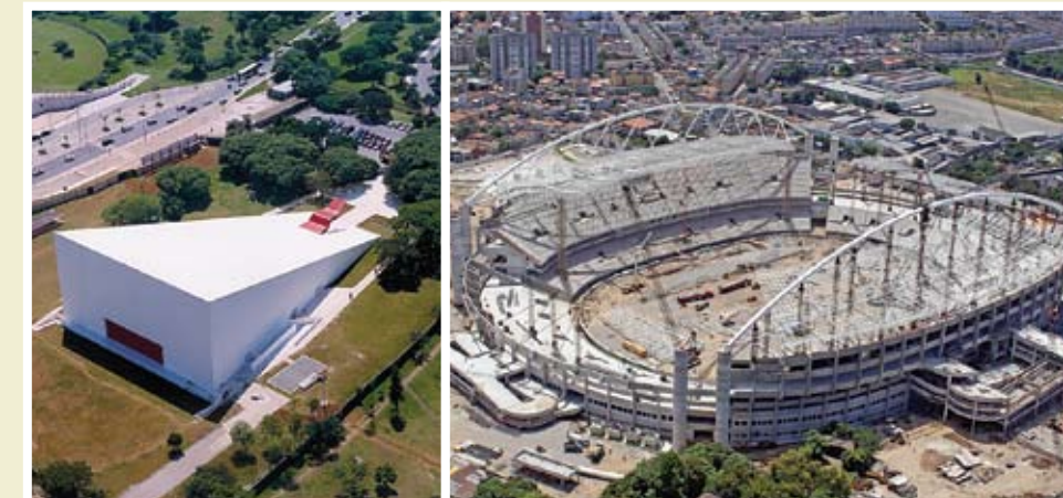
Auditório da TIM-SP | Estádio João Havelange-RJ