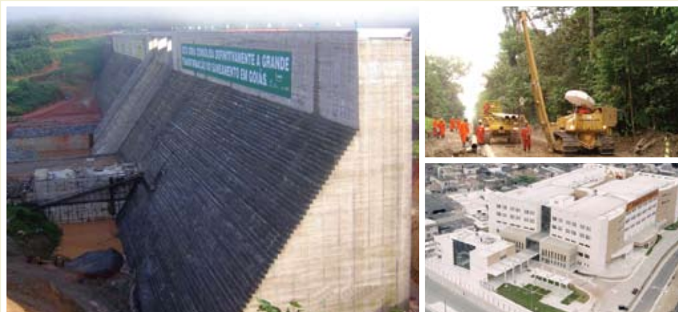
Barragem João Leite-GO | Gasoduto Uruçu Coari-AM | Hospital Acari-RJ